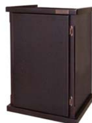
国産ウッドキャビ

オアシスは、国産ウッドキャビや国産ウッドラックへの変更、国産プレミアムフレームレスタンクへの変更の他、濾過槽の仕様変更も可能です。カスタマイズについては販売店へお尋ねください。