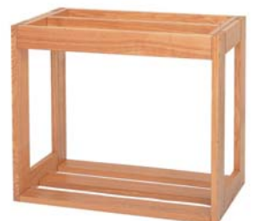
国産ウッドラック

◆写真は全てイメージです。カラーなどが実物と異なって見えることがありますので、ご了承ください。表示価格は税別価格です。商品改良の為、仕様等は予告なく変更する場合があります。